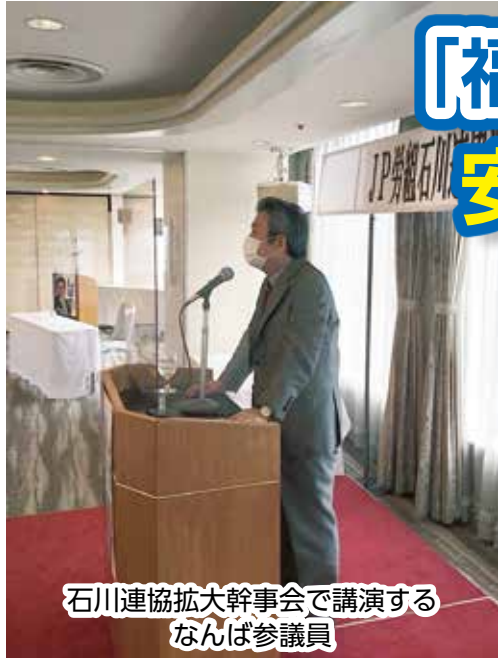
石川連協拡大幹事会で講演する なんば参議院議員