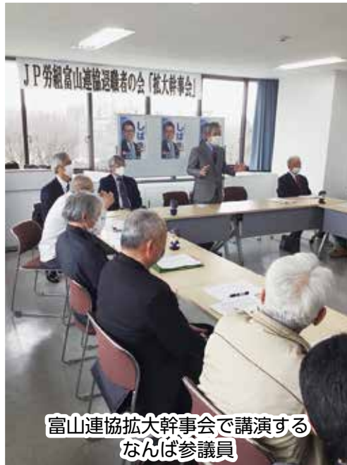
富山連協拡大幹事会で講演する なんば参議院議員